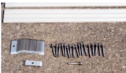
CD座金と取付ボルト