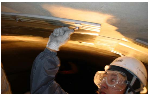
4.SBクリアドレーンの取り付け