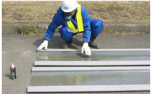
1.クリアドレーン板の前処理