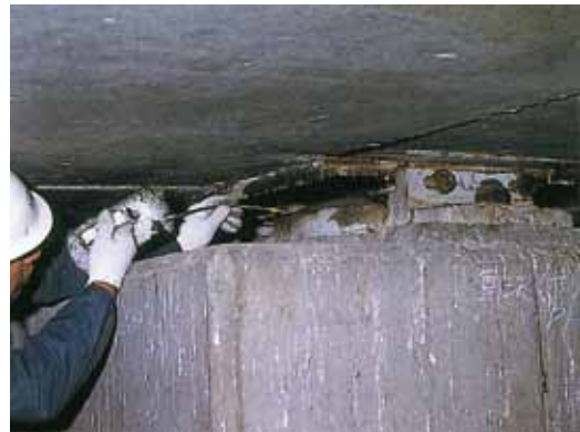
▲潤滑性防せい剤注入